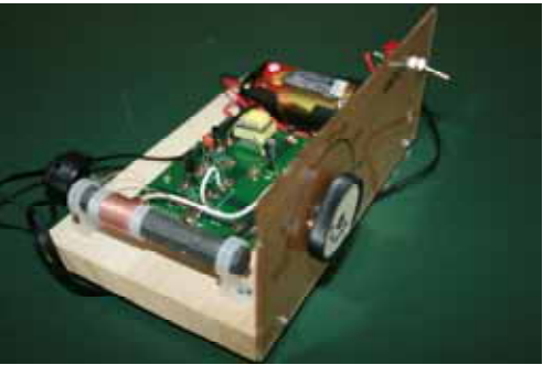
2石トランジスタラジオ完成図

大崎市付近の名勝地 ひまわりの丘：三本木 化女沼古代の里：古川 有備館：岩出山 (有備館は修復工事中) 昭和万葉の森：大衡村